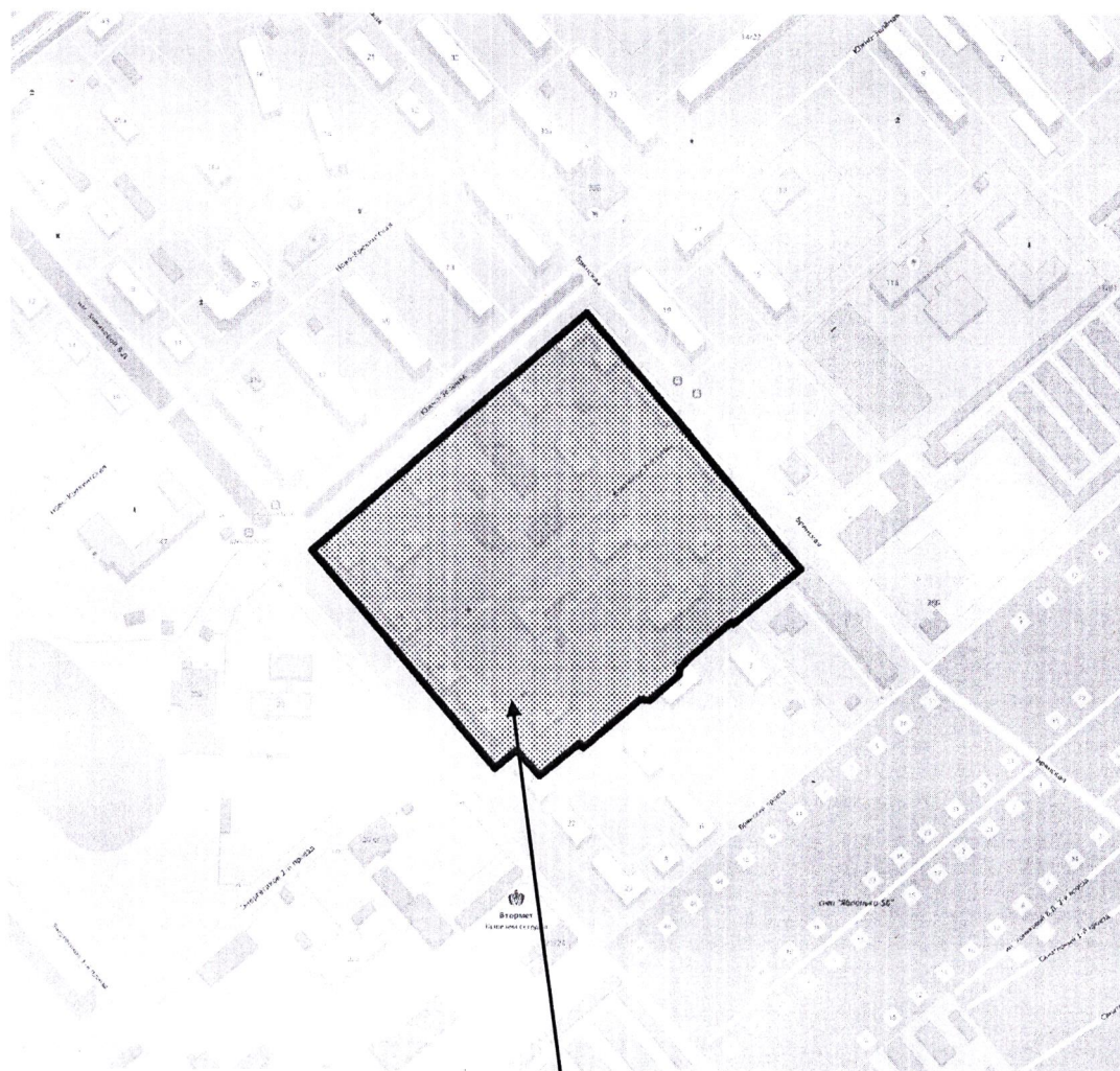
Схема границ территории, ограниченной 1-й Брянский тупик, ул. Брянский, ул. Южно-Зеленой, ул. им. Хомяковой В.Д. в Заводском районе города Саратова

Приложение № 1 к распоряжению министерства строительства и жилищно- коммунального хозяйства Саратовской области от 22.08.2023 № 1124-Р